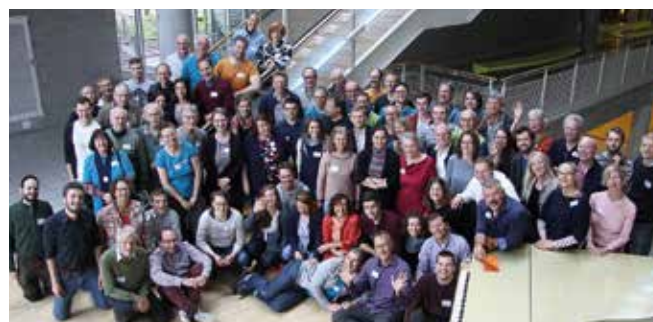
Rencontre internationale des délégués nationaux en 2019 à Stuttgart