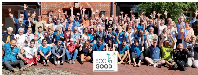
GWÖ Sommerwoche 2024