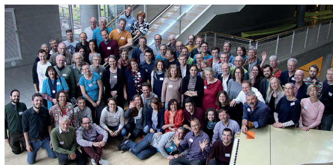
Internationale Delegiertenversammlung 2019 in Stuttgart.