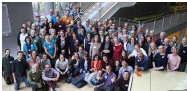
Internationale Delegiertenversammlung 2019 in Stuttgart.