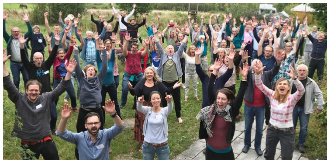
GWÖ Sommerwoche 2020